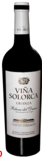
Ref 30 Viña Solorca Crianza 2020- Denominación de Origen Ribera de Duero – 100% Tempranillo- 3 años de crianza – Cajas de 6 botellas 85€