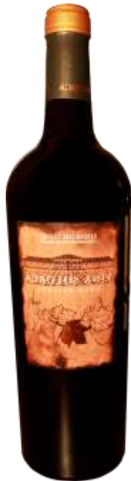
Ref. 31 Gran Solorca Reserva 2018 – D.O. Ribera de Duero -15% Vol. Larga crianza. Cajas de 6 botellas 110€