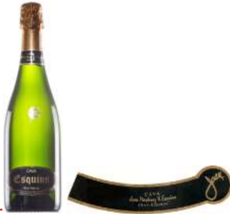
Ref. 8 - Chardonnais