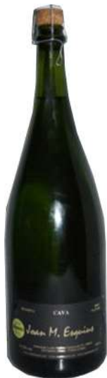
Ref. 9 MÁGNUM JOAN M. ESQUIUS– Brut Nature–Botella de 150 Cl.

Viníferas: Xarel·lo 35% - Macabeo 30% - Parellada 35%